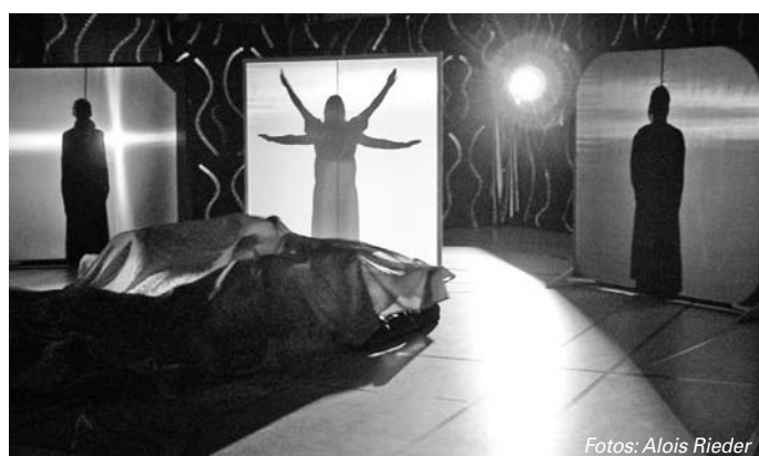
Beeindruckendes Schlussbild nach zweistündigem Programm