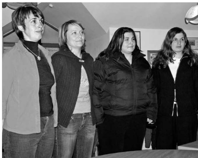
Strahlende Handballdamen, die den MBB-Neujahrsempfang gestaltet hatten