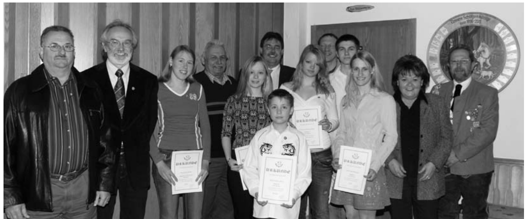
Mit Urkunden und Nadeln in Bronze, Silber, und Gold ehrte der Markt Manching verdiente Sportler