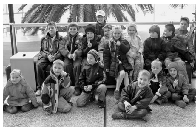
Erste Aktion des Kinder- und Jugendvereins Oberstimm AmiciO: Achtzehn Kinder und sechs Erwachsene besuchten die speziell für Kinder zugeschnittene Audi-Werksführung. Mit Spannung verfolgten die Kinder, wie ein Auto entsteh. Die Kosten übernahm der Verein.