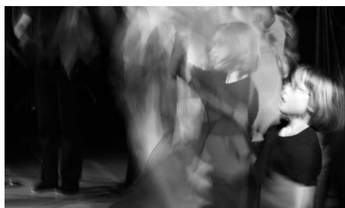
Ein Meer von Farben entsteht beim Jonglieren mit Seidentüchern

Rauschenden Beifall von den insgesamt über 300 begeisterten Zuschauern an zwei Vorstellungsabenden erhielten die jungen Sportlerinnen und Sportler der Abteilung Gymnastik / Turnen der MBB SG Manching für ihre Darbietungen beim 3. Sporttheater in der jeweils vollbesetzten Donauefeldschulturnhalle.