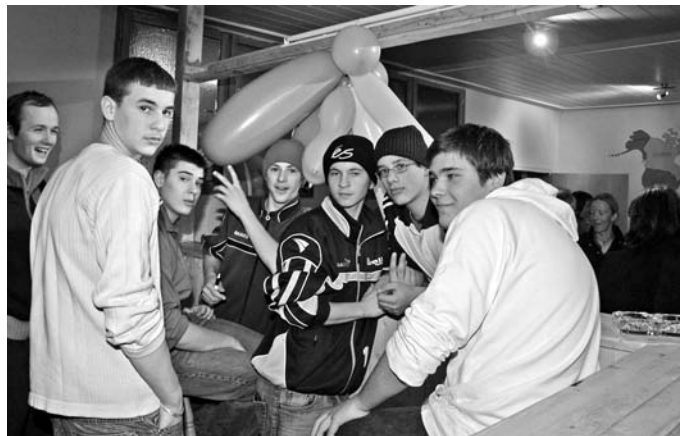
Sichtlich wohl fühlen sich die Jugendlichen in ihren neuen Räumen im „Haus Miteinander“ in Manching-Donauefeld.

50 Stunden verbrachten die Jugendlichen damit, die Kellerräume auf Vordermann zu bringen. Unter handwerklicher Anleitung eines Schreinermeisters wurden eine Theke zusammengezimmert, eine Holzdecke montiert, die Wände getüncht und eine