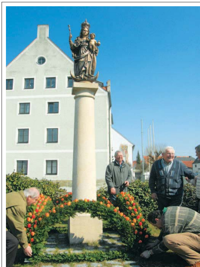
Rechtzeitig zum Osterfest wurde in Manching der Keltenbrunnen und die Mariensäule von den Mitgliedern des Obst- und Gartenbauvereins mit Girlanden und 1500 bunten Plastikeiern verziert.