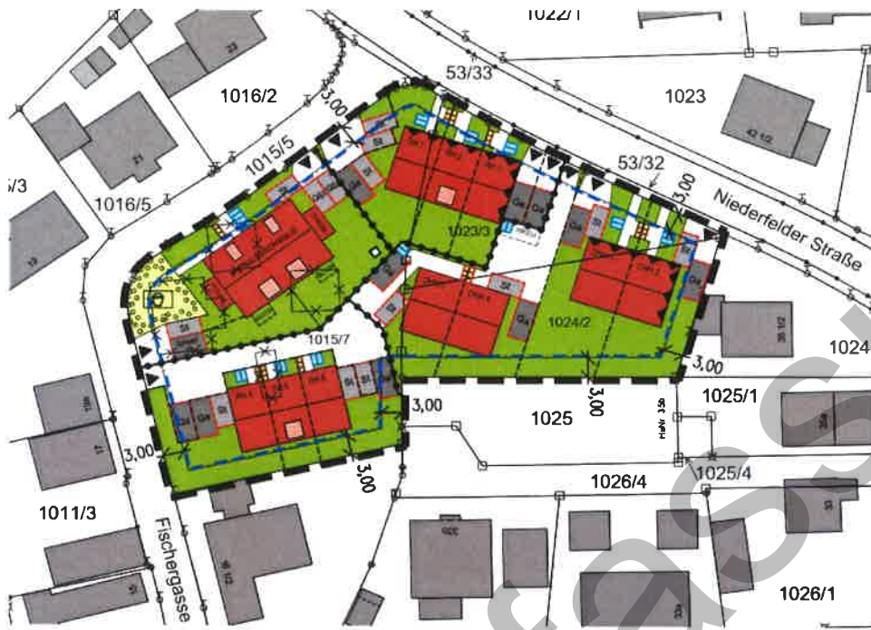
Lageplan zur Aufstellung des Bebauungsplanes Nr. 66 „Wohnquartier an der Niederfelder Straße“