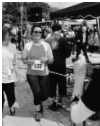
Erfolgreicher Einlauf der Schlusslichter des Hauptlaufes

Start zum Schülerlauf mit über 60 Teilnehmern