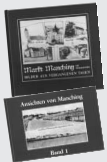
Ein Buch kostet 13 EUR.

Sie zeigen Manching und seine Gemeindeteile, wie es früher einmal war – nicht immer die „gute, alte Zeit“. Die Bildbände sind Raritäten, da sie bereits 1986 bzw. 1988 aufgelegt wurden. Es gibt vor allem nur noch wenige davon. Käuflich zu erwerben sind sie in der Raiffeisenbank Manching und beim Manchinger Autohaus Lang.