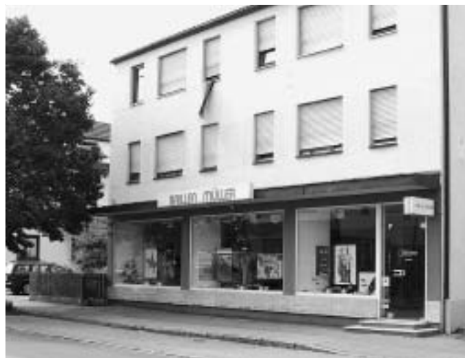
Das Geschäft in der Ingolstädter Strasse in Manching. Die Kunden schätzen die kostenlosen Parkplätze vor dem Geschäft.