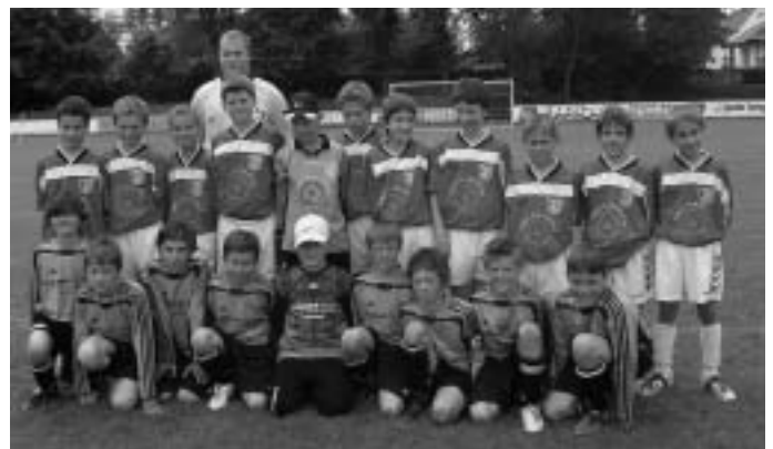
E1-Junioren Pokalturnier: Der SSV Jahn Regensburg (hinten) besiegte im Endspiel den MTV Ingolstadt (vorne) nach Siebenmeterschießen.

Immobilien Obermeier alles i.O. 85077 Manching, Haydnstr. 8, Tel. (0 84 59) 74 11, Fax 3 02 75