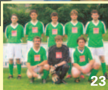
Freiwillige Feuerwehr Pichl – neuer Manchinger Marktmeister