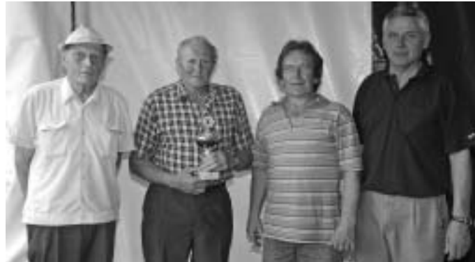
Der Ehrgeiz trieb trotz der hochsommerlichen Temperaturen die verschiedenen Mannschaften beim Sensenmähwettbewerb in Pichl an.