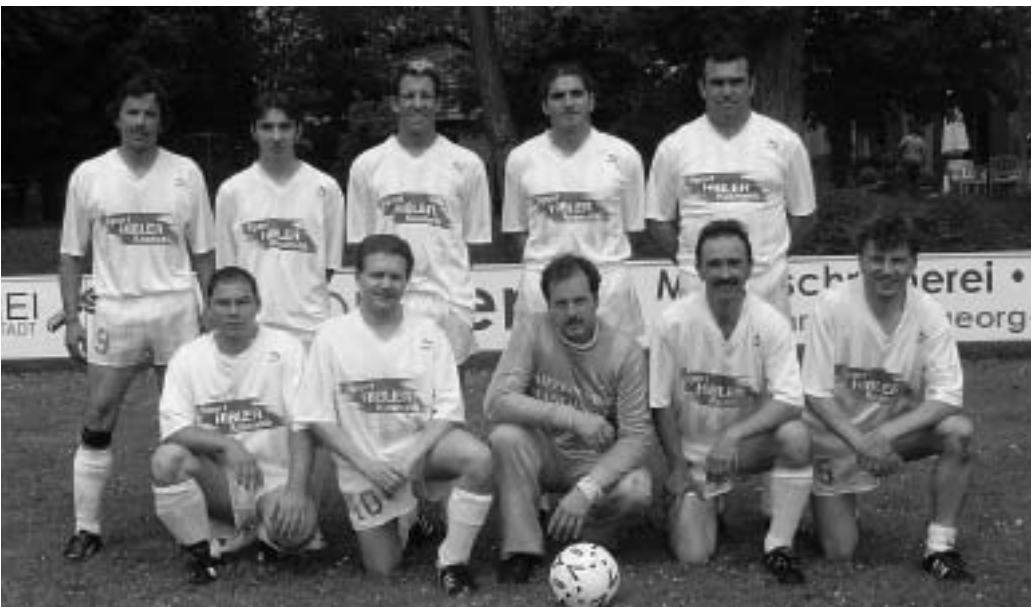
Platz 2 bei der Marktmeisterschaft im Fußball belegten die Sportfischer Manching.