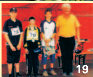
Erfolgreiches Debüt des Manchinger Museumslaufes