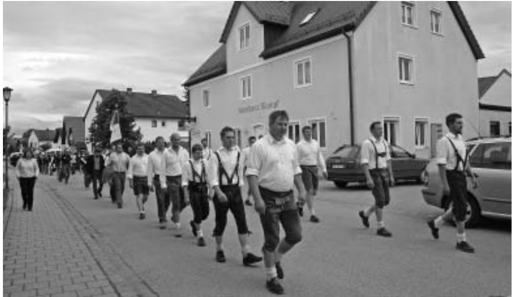
Mit einem Kirchzug und abschließenden Ehrungen feierte der Burschenverein Niederstimm sein 25jähriges Gründungsfest.