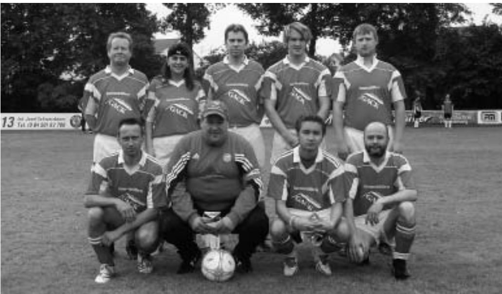
Der 3. Platz ging an den FC Bayern Fanclub.