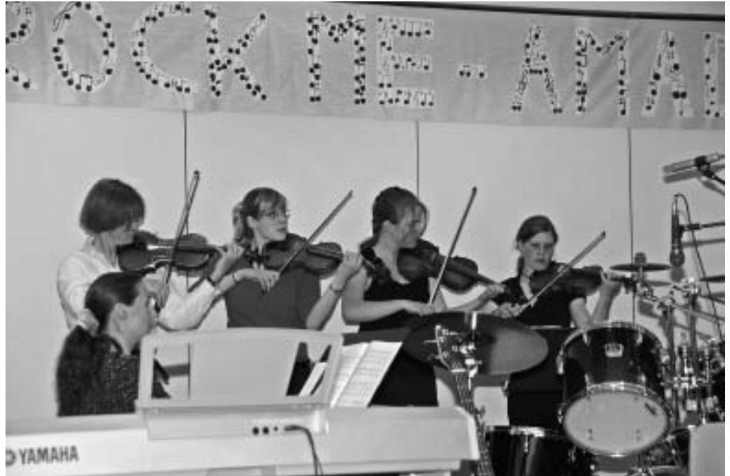
Mit dem Konzert „Rock Me Amadeus“ in der Realschule in Manching präsentierten die Schüler ein Ergebnis auf hohem Niveau.

Um dem Programm den richtigen Pfiff zu geben, trat ein Schüler als Mozart verkleidet auf, der es nicht fassen konnte, dass man ihn nach 250 überhaupt noch kenne. Die musikalische Zeitreise durch das Leben von Mozart begann