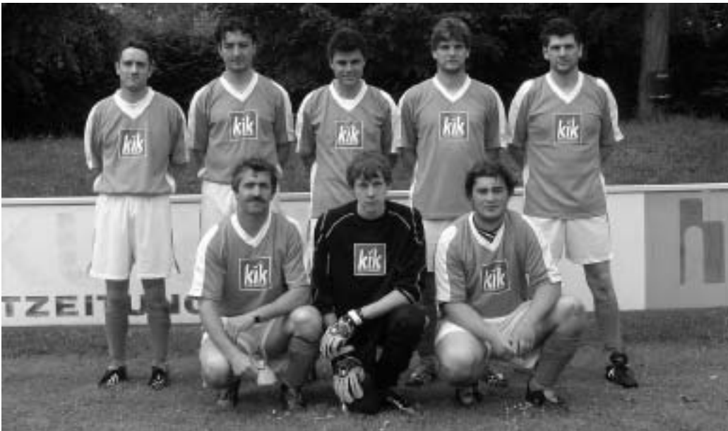
Die Freiwillige Feuerwehr Pichl ist der neue Manchinger Marktmeister im Fußball.