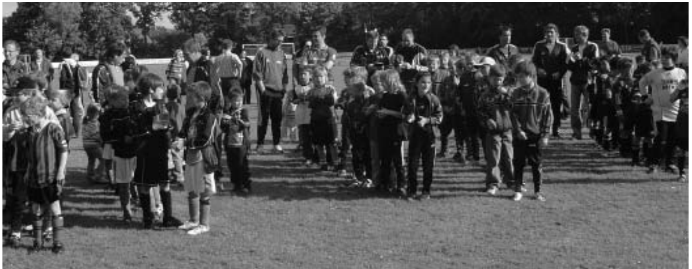
F1-Junioren Pokalturnier: Die Mannschaften stellen sich zur Siegerehrung auf.

In vier Altersklassen ermittelten die Junioren-Fußballer bei den Pokalturnieren in Manching, die zum 33. Mal ausgetragen wurden, ihre Pokalsieger. Insgesamt beteiligten sich an den Pfingsttagen 40 Mannschaften an den Turnieren und boten schönen Jugendfußball.