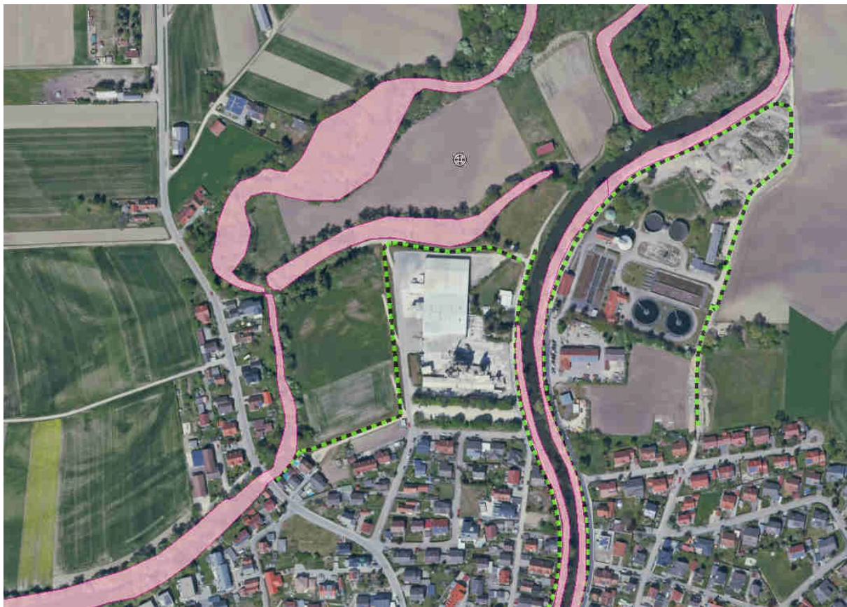
Abb. 5: Objekte der amtl. Biotopkartierung sowie Hochwasser-Schutzmaßnahmen

Das geplante Baugebiet wird durch die Salzstraße an seinem Ost- und durch den Grünweg im Norden vom Schutzgebiet abgetrennt. Anders als das nördlich angrenzende Gebiet ist das Planungsgebiet durch die bestehenden Hochwasserschutzmaßnahmen von dem Überschwemmungsdynamik von Paar und Sandrach abgekoppelt. Unabhängig von der im Gebiet bereits vorherrschenden Intensivnutzung, sind damit die grundlegenden funktionalen Bezüge zum angrenzenden gewässerbezogenen FFH-Gebiet unterbrochen. In Anbetracht dieser Umstände ist die aktuelle wie die potenzielle Bedeutung des Standorts für die benachbarten Schutzgebietsflächen an Paar und Sandrach (FFH-Gebiet 7233-373.05) denkbar gering.