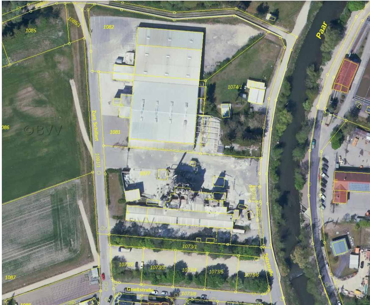
Abb. 2: Luftbild mit digitaler Flurkarte