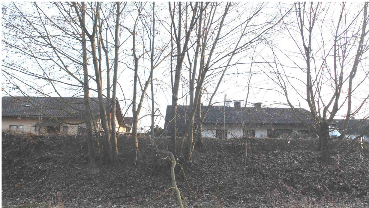
Abb. 8: Wall am Südostrand des Planungsgebietes

Dieser reicht auf der Nordseite des Walles infolge fehlender Nutzung (hier steht wohl seit geraumer Zeit ein Autowrack, zudem wird hier Baumaterial (Schotter) gelagert) über den Böschungsfuß hinaus in die Schotterflächen hinein. Die Südseite ist zumeist dicht von Altgras bewachsen, offene sandige Bereiche, die beispielsweise von der Zauneidechse als Habitatstrukturen genutzt werden könnten, wurden bei der Ortseinsicht nicht festgestellt.