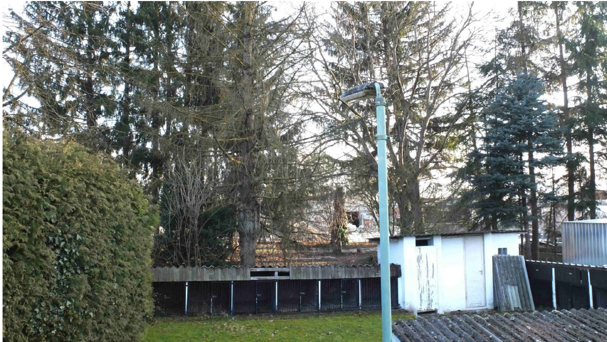
Abb. 6: Überwiegend naturferner Gehölzbestand im Süden von Fl.Nr. 1074/1

Ohne besondere Artenvorkommen sind auch die Rasenflächen auf 1074/1 einzustufen, die derzeit von der Ortsgruppe des Schäferhundevereins genutzt und gepflegt werden. Der Gehölzbestand, der auf diesem Grundstück stockt, ist überwiegend standortfremd oder naturfern. Dies gilt zum einen für die Thujenhecke im Südosten des Vereinsheims, zum anderen für die Fichten, die den Gehölzbestand unmittelbar an der Hallenwand und im Südosten des Grundstücks bestimmen. Etwas höher ist die potenzielle naturschutzfachliche Bedeutung eines Walnussbaums und eines Kirschbaums. Für den Artenschutz besonders relevante Höhlen fehlen aber auch an diesen Bäumen.