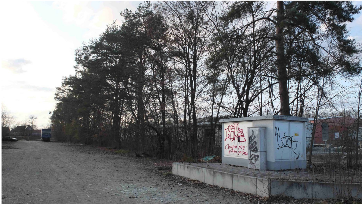
Abb. 7: Von Kiefer und Spitzahorn geprägte Grünfläche auf Fl.Nr. 1073/1

Dieser reicht auf der Nordseite des Walles infolge fehlender Nutzung (hier steht wohl seit geraumer Zeit ein Autowrack, zudem wird hier Baumaterial (Schotter) gelagert) über den Böschungsfuß hinaus in die Schotterflächen hinein. Die Südseite ist zumeist dicht von Altgras bewachsen, offene sandige Bereiche, die beispielsweise von der Zauneidechse als Habitatstrukturen genutzt werden könnten, wurden bei der Ortseinsicht nicht festgestellt.