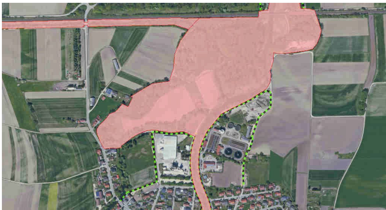
Abb. 4: FFH-Gebiete 7433-371 und 7233-373 sowie Hochwasser-Schutzmaßnahmen

schwemmungsgebiet noch in der Kulisse der Gefahrenflächen für ein 100jähriges Ereignis. Lediglich bei einem Extremhochwasser ( HQ_{1000} ) kann es laut Berechnungen des Wasserwirtschaftsamts hier wie in großen Teilen des Marktgebiets zu Überschwemmungen kommen (zu erwartende Wassertiefen dann zumeist bis 0,5 m, punktuell bis 1 m).