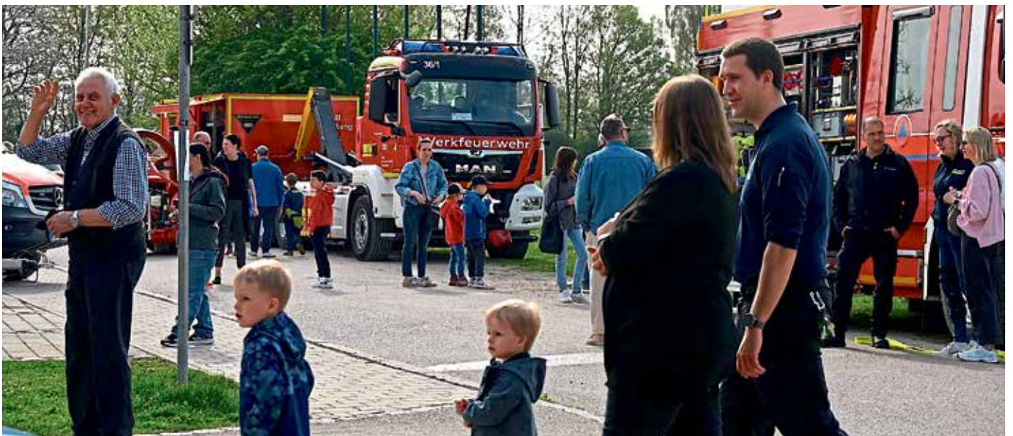
Viel Spaß und Freude hatten die Kinder am Blaulichttag bei der Pichler Feuerwehr.