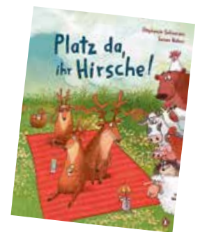
Markt Manching (FM)

Die kostenlose Veranstaltung ist für Kinder ab 3 Jahre und dauert ca. 30 Minuten. Termin: Mittwoch, 10.06.2026 um 15:30 Uhr & 16:30 Uhr mit dem Titel: „Platz da, ihr Hirsche!“ von Stephanie Schneider und Susan Batori.