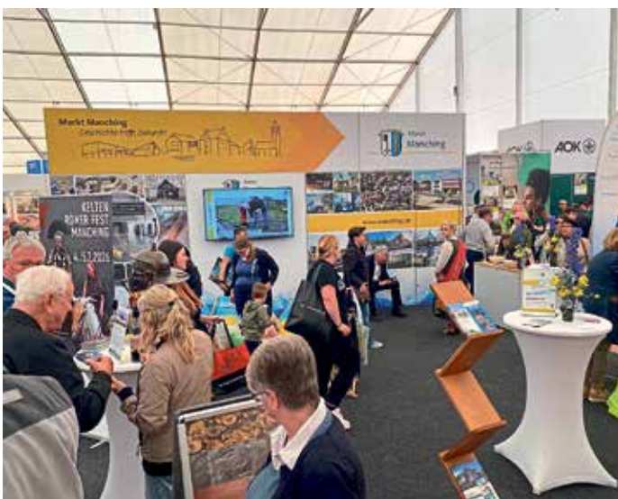
Jährlich eine beliebte Anlaufstelle für Bürger und Touristen.