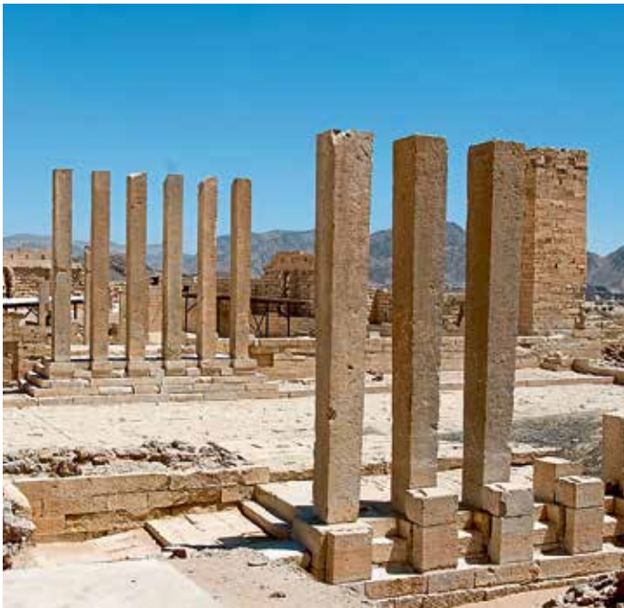
Der Tempel des Almaqah in der sabäischen Stadt Sirwah.