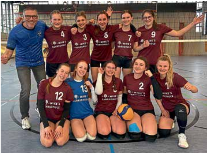
Zweite Volleyballdamenmannschaft der MBB-SG Manching