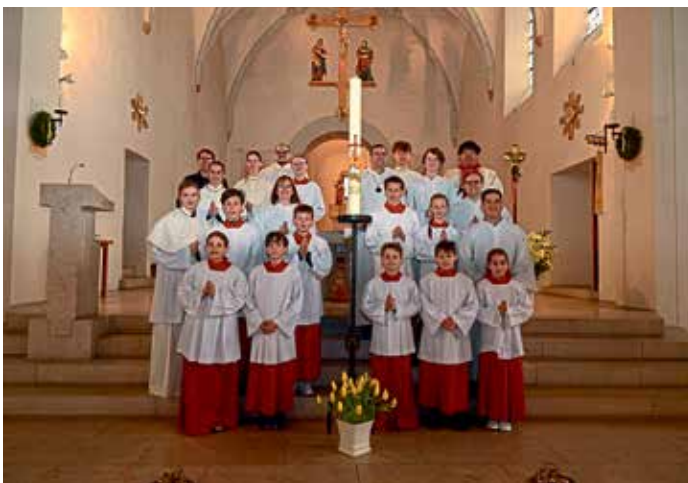
Text und Foto: Max Schmidtnr

nem Frühschoppen im Pfarrsaal, den die Manchinger Muiggassler musikalisch umrahmten. Es war wieder interessant und schön, nach so vielen Jahren wieder am Altar zu stehen, erzählte ein ehemaliger Ministrant mit fast leuchtenden Augen. Bei dem gemeinsamen Frühschoppen wurde dann so manches aus der Ministrantenzeit wieder in Erinnerung gebracht.