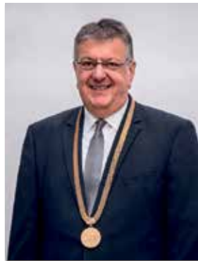
Nerb Herbert 1. Bürgermeister