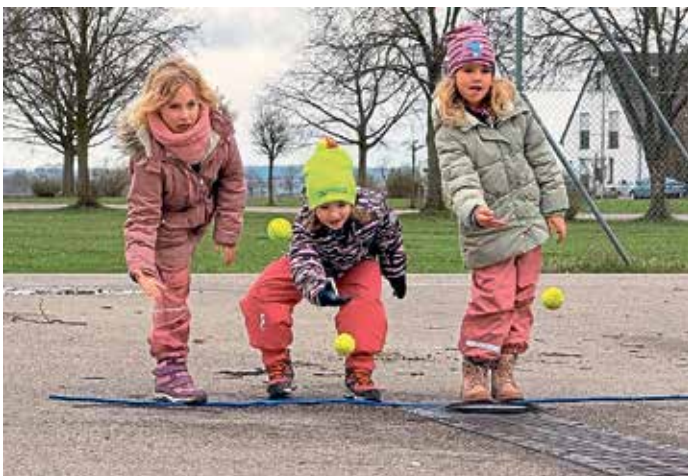
Wettbewerb mit Tennisbällen

Schrobenhausen. Zuletzt gab es auch beim TSV Baar-Ebenhausen einen klaren 3:0-Erfolg mit Satzgewinnen von 25:16, 25:20 und 25:8 Punkten. Mit nur drei Niederlagen während der gesamten Saison erreichten die Manchinger mit 20:10 Punkten somit den zweiten Platz hinter dem MTV Pfaffenhofen (25:5) und einem einzigen Satzgewinn vor dem TSV Hohenwart (19:11) und holten so die Vizemeisterschaft dieser Spielgruppe. Alois Rieder