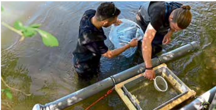
Gut zu erkennen sind die Fischeier die mit einem Seier in den schwimmenden Brutkasten eingefüllt werden.

Im Rahmen eines Artenschutzprogramm setzten die Manchinger Sportfischer an einer geeigneten Stelle in der Paar, bei Pichl 10.000 Augenpunkteier Gesamtgewicht 400 Gramm, in einem Brutfloß zur Aufzucht ein. Die kleinen Fischeier wurden in