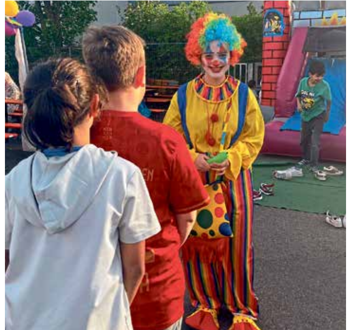
Der Clownauftritt vor begeistertem Publikum