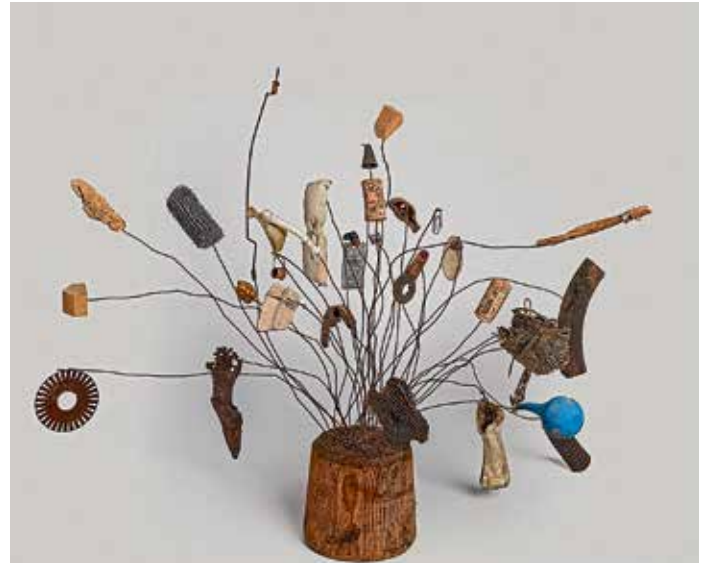
Die Installation »Fundgras«, eine visuelle Poesie modernen Abfalls.