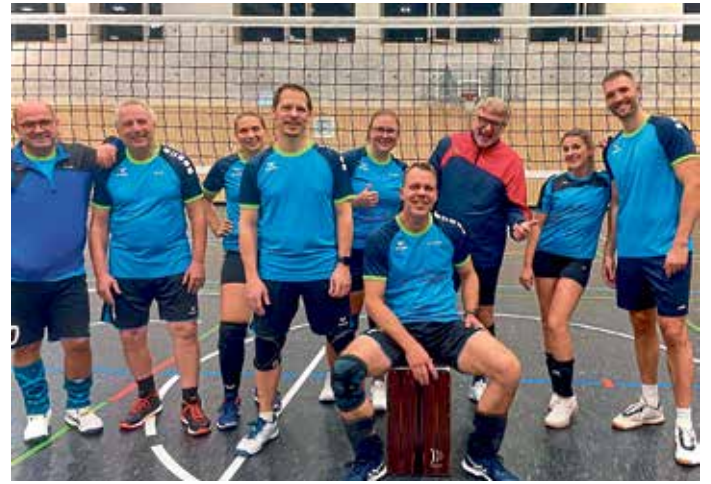
MBB-Mixedvolleyballer holen Vizemeisterschaft