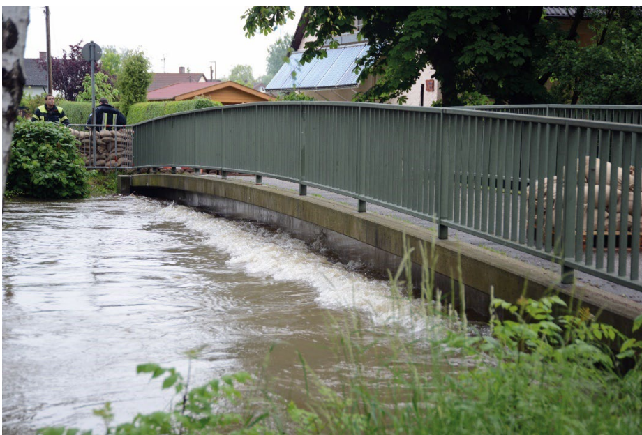
Bisheriger Steg über der Paar eingestaut beim Hochwasser 2013.

Die Errichtung eines lediglich neuen Steges an der für die Brücke vorgesehenen Stelle ist vom Marktgemeinderat derzeit nicht vorgesehen. Es gibt weder Beratungen, Planungen noch Beschlüsse. Der alte Steg an der Paarstraße entfällt dann ohne Ersatz, da von der geplanten neuen Brücke ca. 170 Meter weiter entfernt am Rathaus bereits ein Steg existiert, den Fußgänger und Radfahrer nutzen können.