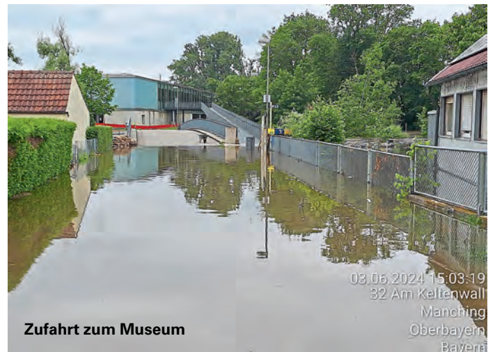
03.06.2024 15:03:19 32 Am Keltenwall Manching Oberbayern Bayern