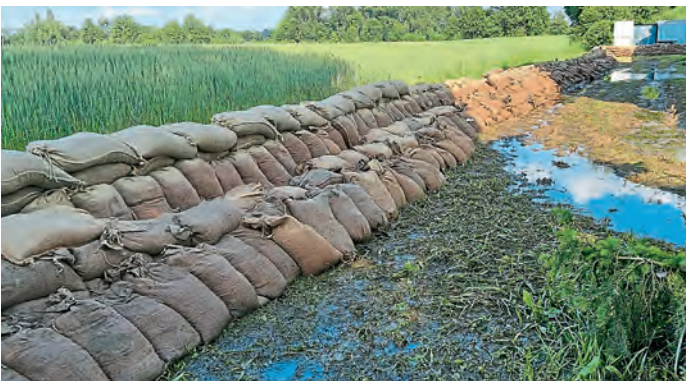
2. Damm hinter Feuerwehrhaus Pichl