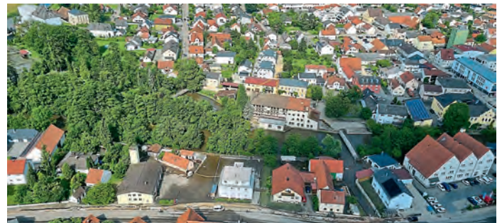
Ehemaliger Mathes Bräu und Bergstraße