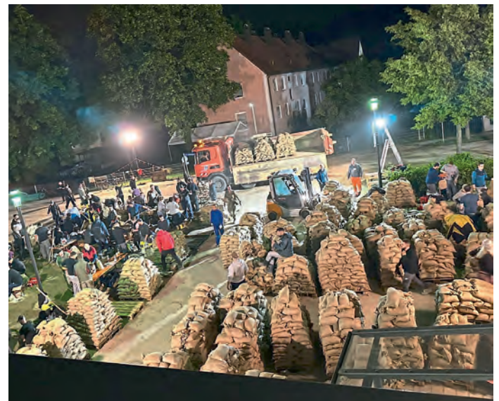
Sandfüllstation 1: Feuerwehrhaus Manching