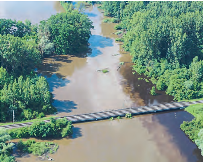
Sogenannte Eisenbahner Brücke