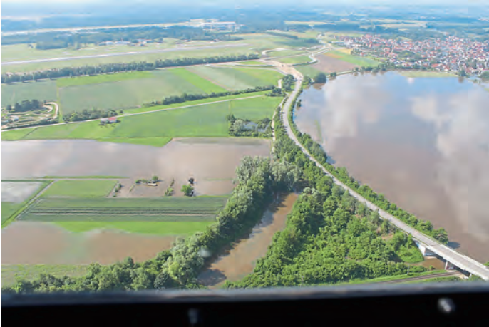
Manching-Ost: Blick Richtung Süden