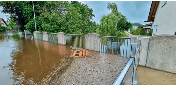
Äußere Niederfelder Str.: Dammbalkenverschluss bei Urfer