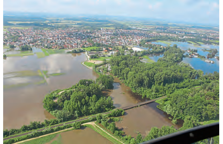
Manching von Norden gesehen (Mitte Kläranlage)