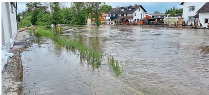
Sicht von Trachtenheim-Terrasse Richtung Paarstraße