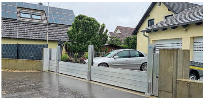
Dammbalkenverschluss ein Beispiel: Am Burgfeld-Sternau