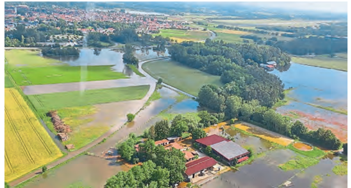
Pferdehof Bals in Blickrichtung B16 (Manching)