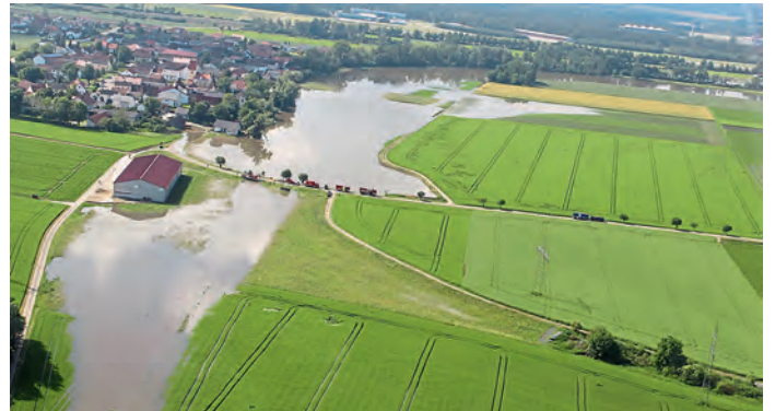
Westenhausen: Blick nach Süden