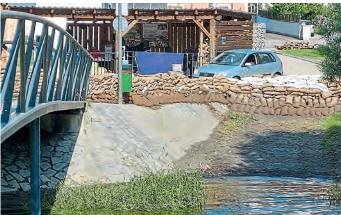
Steg beim Griechen