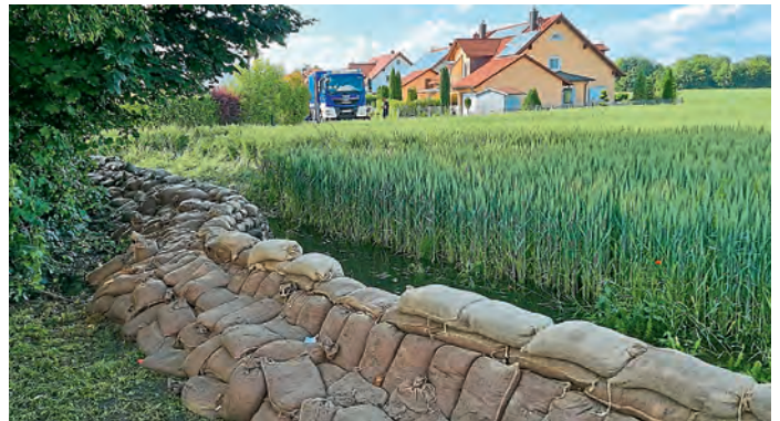
2. Damm hinter Feuerwehrhaus Pichl