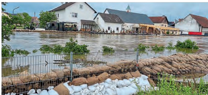
Sicht von Trachtenheim-Terrasse Richtung Paarstraße