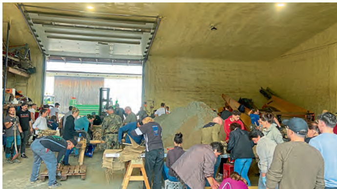
Sandfüllstation 2: Bauer-Halle Oberstimm