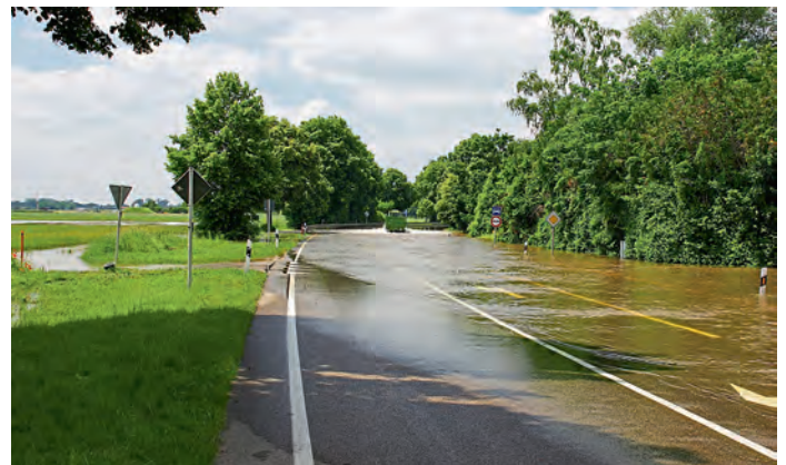
B16: Einfahrt Lindach