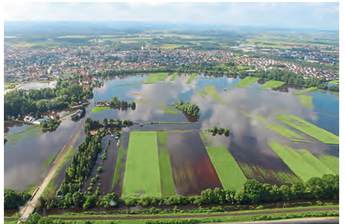
Bahnstrecke Regensburg / äußere Niederfelder Straße