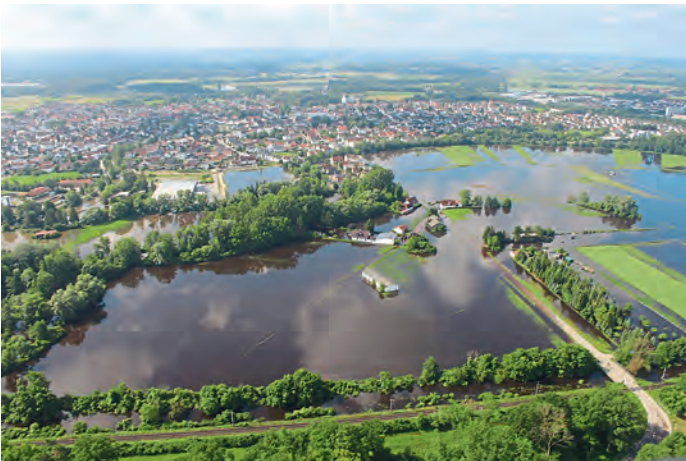
Äußere Niederfelder Str. Bahnstrecke Regensburg