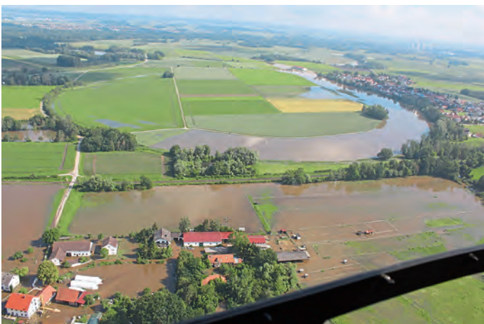
Vorne: Lindach; rechts oben Westenhäusen