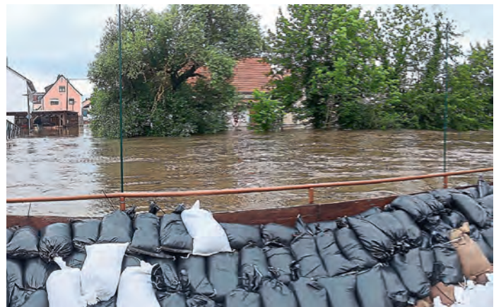
Sicht von Gebäude Mathes Bräu Richtung Bergstraße (Grieche)