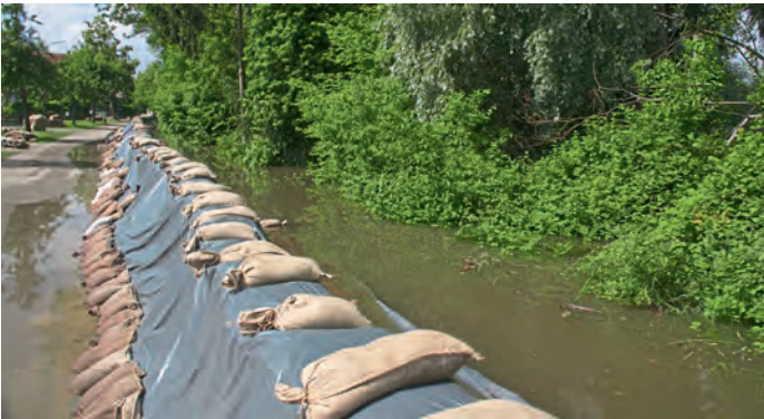
Damm an der Ach entlang