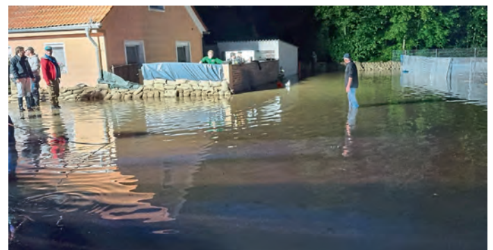
Bergstraße bei altem Feuerwehrhaus