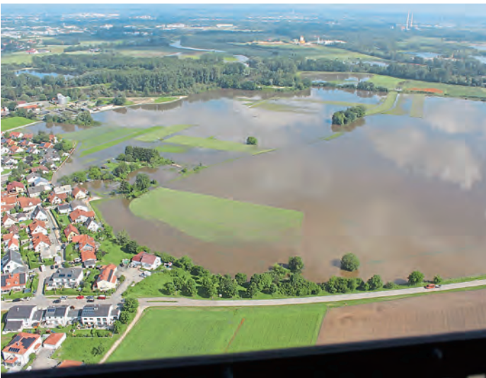
Bahnhofstraße / hinten links Kläranlage