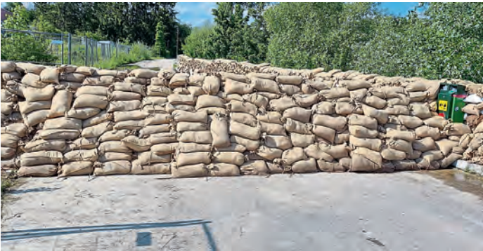
2. Damm zwischen Paar und Quick-Mix