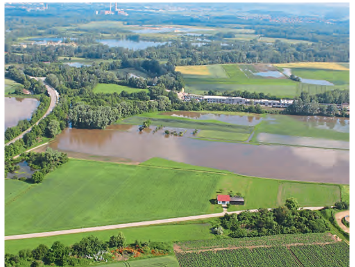
Von links nach rechts St. 2335; Auto Bierschneider (Bahnhof); Moto-Cross-Strecke