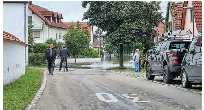
Wasser fast bis Ortsmitte