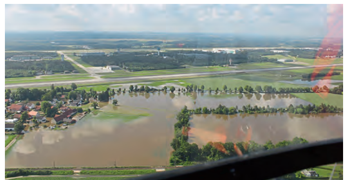
Links: Lindach; rechts Lindacher Weiher