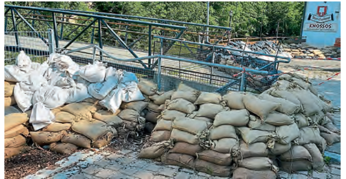
Steg bei ehemaligen Mathes Gelände