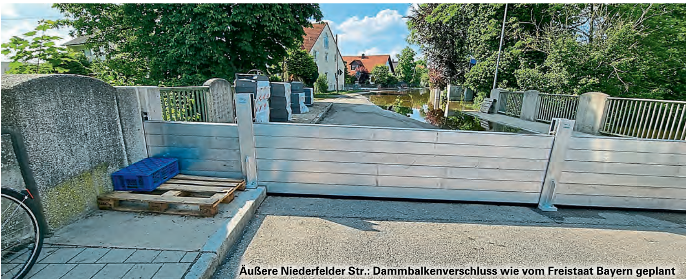
Äußere Niederfelder Str.: Dammbalkenverschluss wie vom Freistaat Bayern geplant