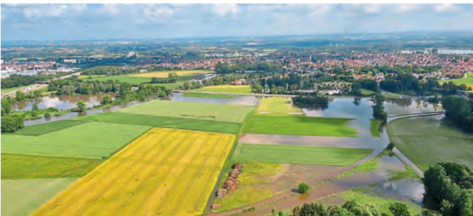
Von links nach rechts Autobahnweiher-B16 bis EC-Tankstelle