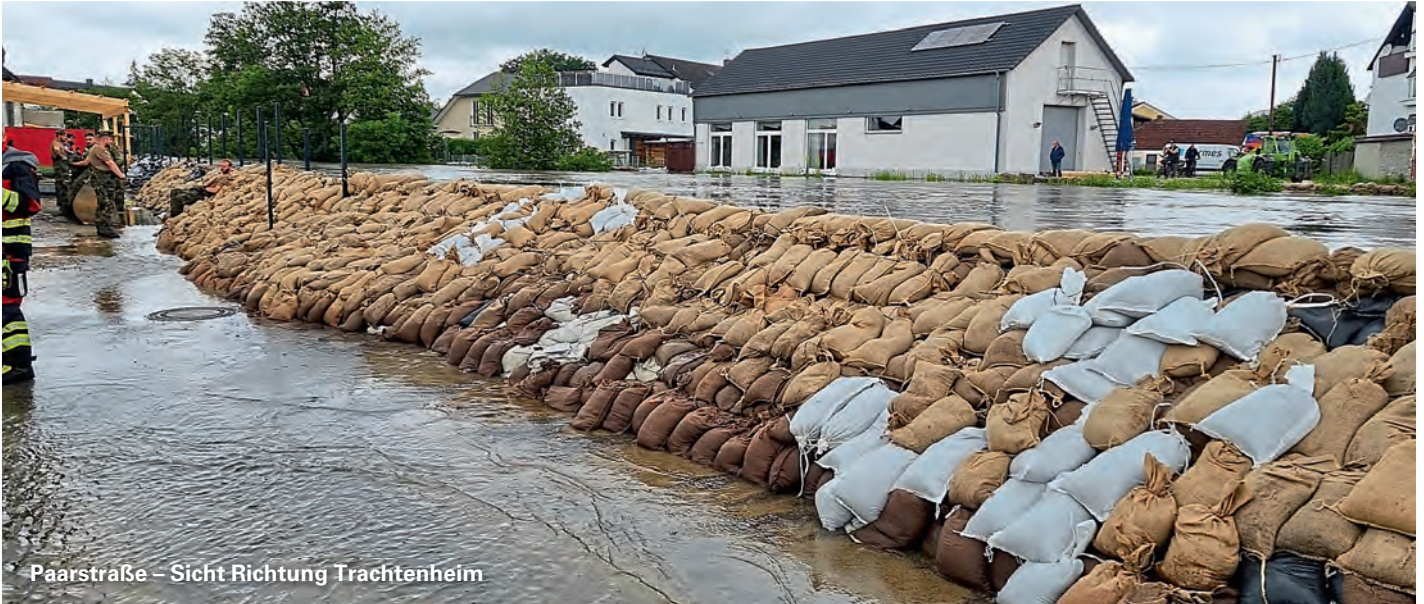
Paarstraße – Sicht Richtung Trachtenheim