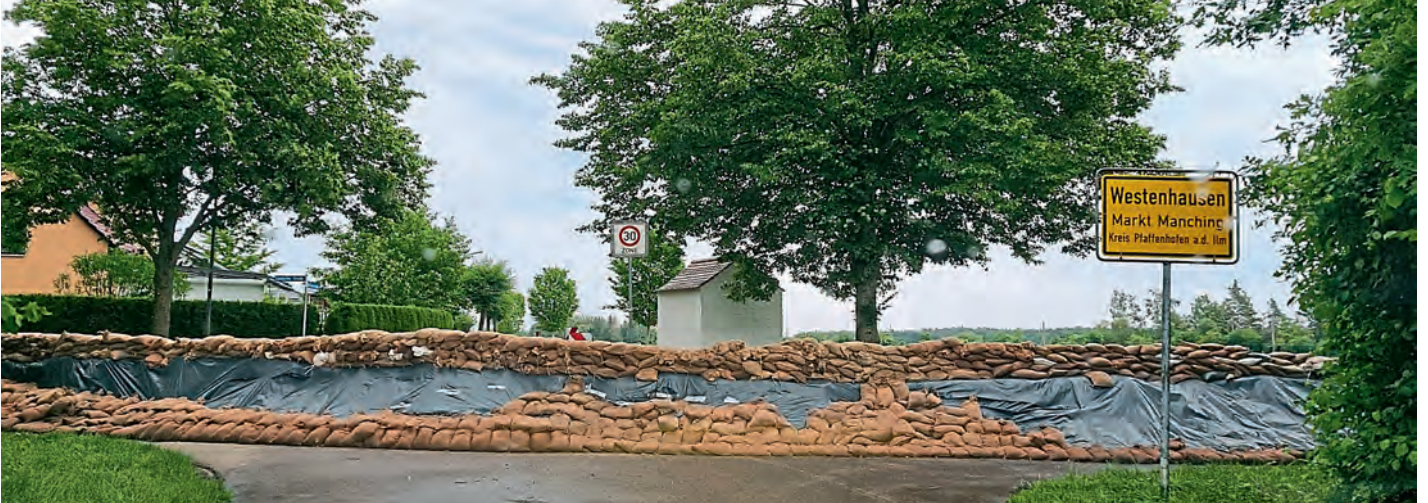
Damm von Außenansicht: Westenhausen