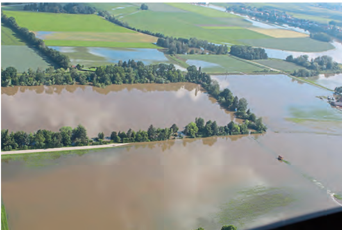
Mitte: Lindacher Weiher; rechts Lindach

Bad mit Dusche und ein kleiner Garten, in dem sich der kleine Hund wohlfühlen kann. Sollten Sie helfen können oder einen Hinweis haben, melden Sie sich bitte beim Markt Manching unter Tel. 08459 85-0 oder per E-Mail an info@manching.de .