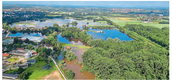
Allgemeine Übersicht: zwischen Kläranlage und äußere Niederfelder Str.