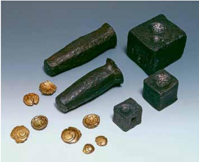
Keltische Münzstempel und Regenbogenschüsselchen aus Südbayern.