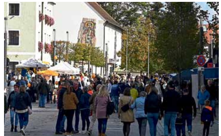
Der Spätsommerliche verkaufsoffene Sonntag zog Tausende von Besucher auf die Straßen von Manching. Max Schmidtnr

Besuchern, mit verbundenen Augen einige schwimmende Enten aus dem Wasser. Max Schmidtnr