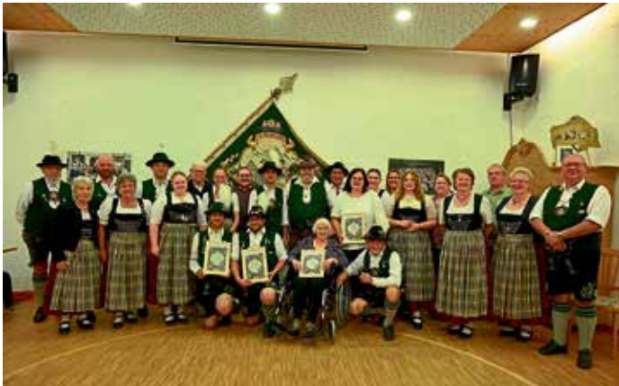
Neuwahlen und Ehrungen standen bei den Trachtlern in Manching auf der Tagesordnung.