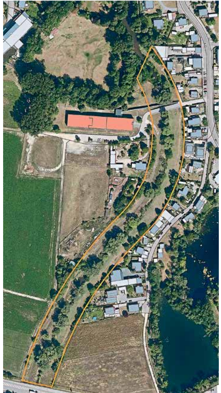
Orange Linie zeigt Maßnahmengbiet