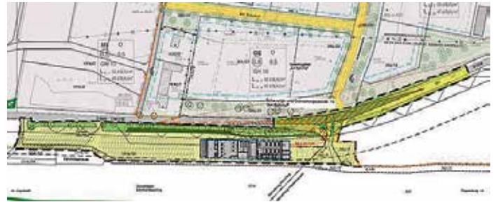
Lageplan 01 zur Aufstellung des vorhabenbezogenen Bebauungs- und Grünordnungsplanes Nr. 58 „Am Bahnhof IV“

Datenschutz: Die Verarbeitung personenbezogener Daten erfolgt auf der Grundlage der Art. 6 Abs. 1 Buchstabe e der Datenschutz-Grund-