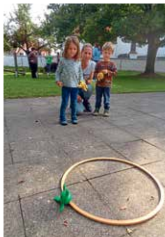
klein oder groß, ein schöner Nachmittag. Markt Manching (Ba)

Jede Gruppe des Pichler Kindergarten veranstalteten im September ein Kennenlernpicknick. Die Strolchengruppe hatte am Montag, den 23. September, ihren großen Tag. Alle Kinder durften mit ihren Familien nachmittags den Kindergarten besuchen. Es erwartete sie ein buntes Programm. Gut, dass das Wetter mitgespielt hat, denn unser Picknick fand im Freien statt und es wurden verschiedene Spielstationen, wie z.B. Frosch-Weitwurf, Sackhüpfen und Fahrzeug-Ralley aufgebaut. Durch das gemeinsame Beisammensein konnten sich die Eltern untereinander besser kennenlernen. Es war für alle, egal ob