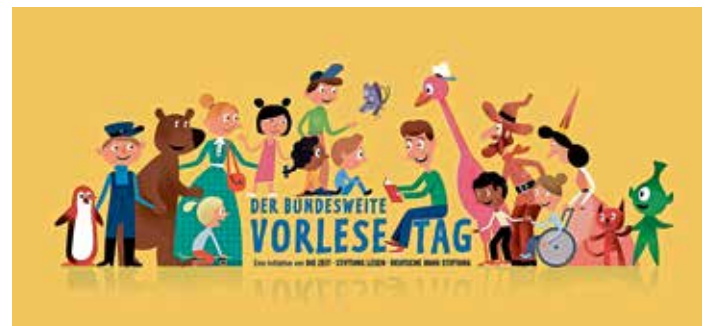
Markt Manching (FrM1)

Die kostenlose Veranstaltung ist für Kinder ab 3 Jahre. Der Aktionstag ist eine Initiative von DIE ZEIT, der Deutschen Bahn AG/Deutsche Bahn Stiftung sowie der Stiftung Lesen.